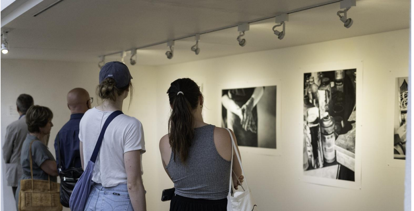
Vernissage de l'exposition Habilis – Le geste, l'esprit et la matière, 3 juillet 2024.