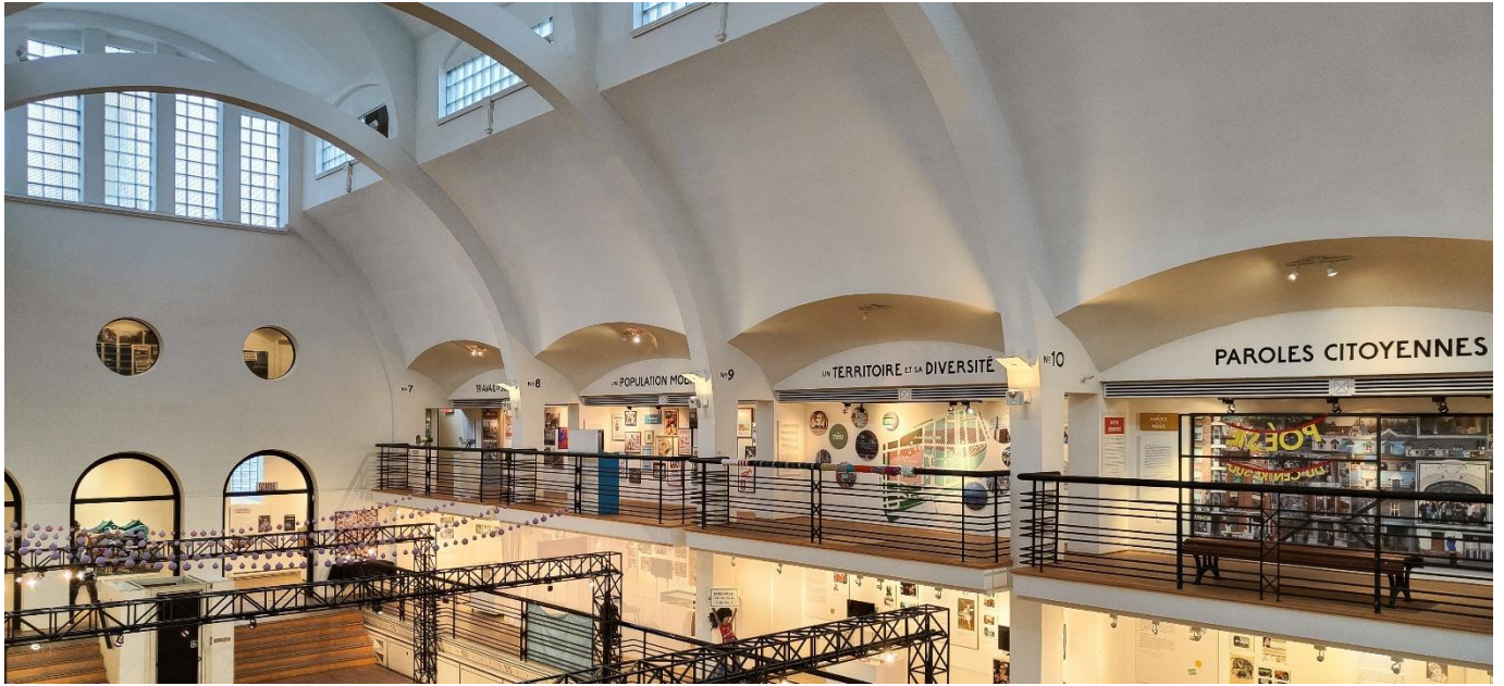
Vue de la grande salle d'exposition et de l'exposition permanente, sur la mezzanine.