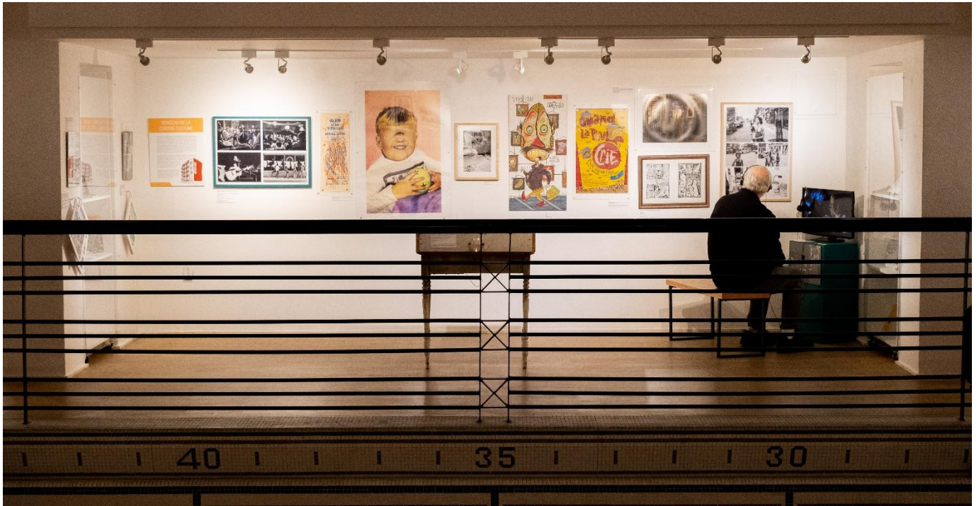
Une section de l'exposition Carrefours et culture : la rue Ontario des Faubourgs , automne 2024.