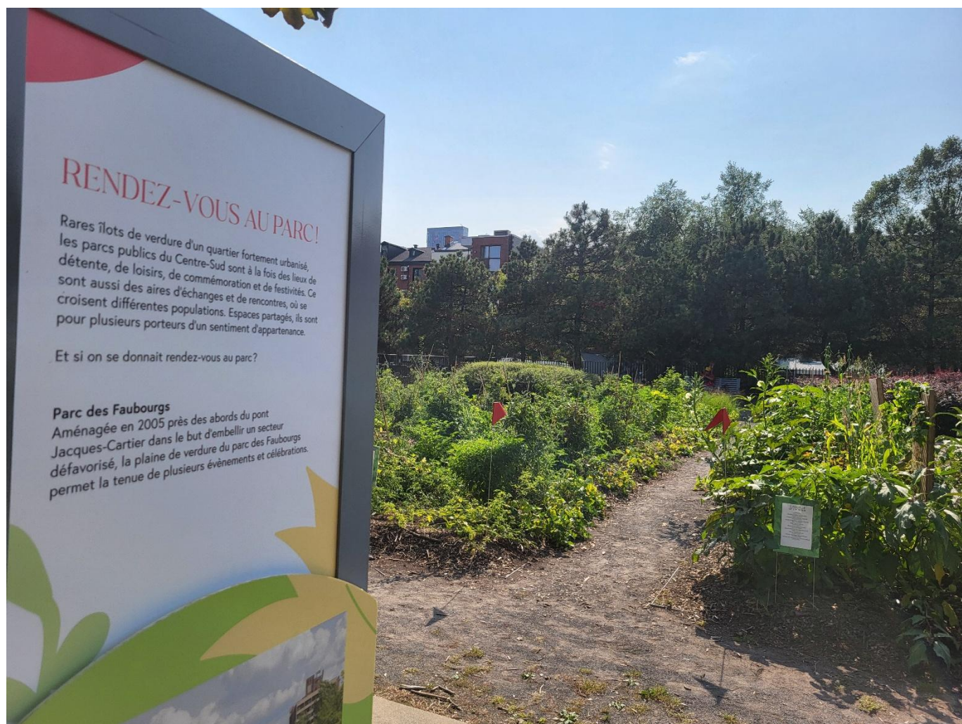
Un panneau de l'exposition Au cœur du Centre-Sud : espaces publics, espaces partagés , dans le jardin d'art de la Grande Bibliothèque.