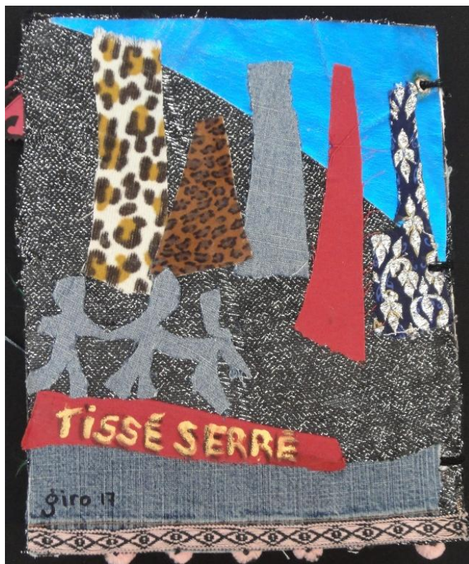
Couvertures, avant et arrière, d'un cahier regroupant des témoignages d'appui de citoyens et citoyennes au maintien du comté Sainte-Marie – Saint-Jacques. Conception : Marie Giro, 2017