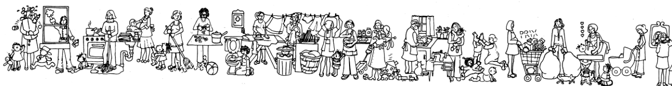
Premier logo de Remue-ménage, 1976.

Les Éditions du remue-ménage ont été fondées dans la mouvance de l'Année internationale de la femme de 1975, à Montréal, par un collectif de femmes qui souhaitent faire connaître un autre versant de la mémoire collective. En mars 1976 était lancée leur première publication, la pièce du Théâtre des cuisines Moman travaille pas, a trop d'ouvrage . Fières du travail accompli, les Éditions du remue-ménage persistent et signent leur engagement à produire une littérature d'idées, à demeurer un lieu de débats et, à l'instar du mouvement des femmes, à travailler à la construction d'un monde plus juste.