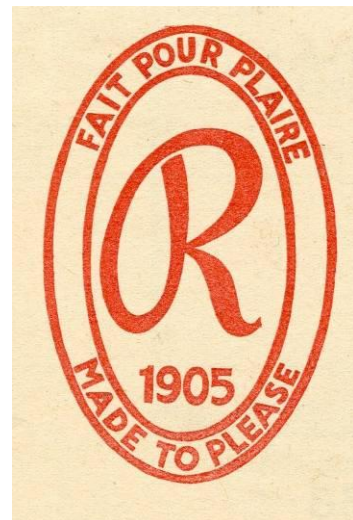
Logo de l'entreprise, vers 1965.