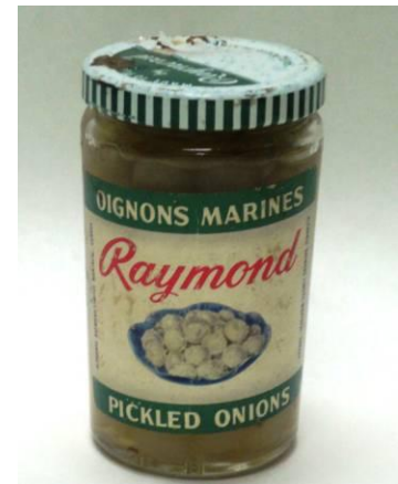
Pot de petits oignons Raymond, vers 1970 Collection Marguerite Landriault-Raymond, Écomusée du fier monde

La mayonnaise et le catsup Raymond, le ketchup, ont aussi occupé une place de choix sur les tablettes des épiciers. D'autres produits moins courants, comme du sirop de table, des garnitures à tartes, ou des « sandwich spread », des mélanges à sandwich, ont aussi été commercialisés à certaines époques.