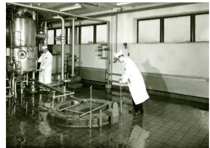
Des ouvriers dans l'usine, vers 1955.

Une fois parvenus à l'usine, les fruits et les légumes subissent différents traitements. La mise en conserve des légumes se déroule dans les installations de Longueuil. Une fois préparés, ils sont mis en boîte et envoyés à l'entrepôt avenue Lalonde. Les produits mis en pot, comme les confitures, les marinades, la mayonnaise et le catsup, sont fabriqués dans l'usine de la rue Panet. L'élaboration des recettes résulte aussi des expériences menées à l'usine. Dans les années 1960, un agronome et un biologiste dirigent le laboratoire.