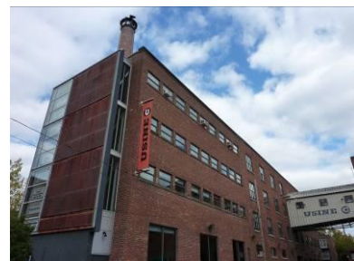
Usine C, 2009. Écomusée du fier monde