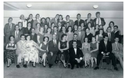
Une fête des employés de Raymond, vers 1950.

En ce qui concerne les confitures, les fraises sont d'abord reçues et équeutées à l'entrepôt, avant d'être transférées à l'usine. Chaque été, des garçons et des filles d'à peine 10 ans y équeutent des fraises, assis sur des tabourets. Même si la priorité était donnée aux adultes, les enfants constituent une part importante de la main d'œuvre saisonnière. Ils reçoivent, à la fin des années 1940, un sou du casseau. Les fraises sont ensuite placées dans de volumineux cuiseurs et mélangées au sucre. Des ouvrières les brassent à l'aide de grandes cuillères de bois ressemblant à des rames. À la suite de l'agrandissement de l'usine, au milieu des années 1950, la production est automatisée et les confitures sont alors cuites sous vide.