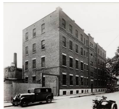
Usine Alphonse Raymond, rue Panet, vers 1936.