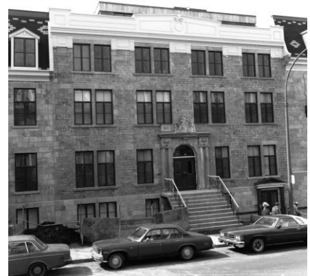
La maison située au 1640, rue Saint-Hubert, peu après sa reconstruction en 1977.

Lorsque les Pères Blancs s'installent rue Saint-Hubert, la maison se trouve dans un espace urbain marqué par la proximité du Quartier latin. L'architecture victorienne des bâtiments avoisinants témoigne du caractère bourgeois de cette artère. La présence de nombreuses institutions et communautés religieuses caractérise le secteur. Le choix du site s'explique par la proximité des infrastructures de transport. Le port de Montréal se trouve à moins d'un kilomètre, alors que plusieurs gares ferroviaires sont facilement accessibles. En plus d'être une résidence pour les missionnaires, le bâtiment est aussi une « procure » : un lieu destiné à recueillir les dons et le matériel qui sera ensuite expédié en Afrique tels que bidons à essence, manuels scolaires ou médicaments. La maison devient même, à une époque, la seule et unique procure des Missionnaires d'Afrique en Amérique du Nord. La présence d'une main-d'œuvre ouvrière abondante dans le quartier est également utile. Le travail de manutention est important et les frères doivent pouvoir compter sur des bras supplémentaires pour la réception et l'expédition. Cet aspect du travail des Pères Blancs va progressivement décliner et disparaître à la fin du 20 e siècle.