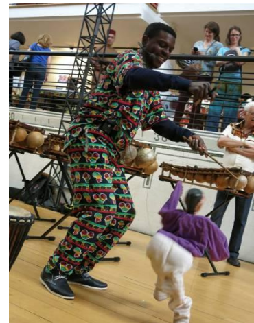
10 e Journées africaines, 2014.

La création du Centre Afrika se concrétise en 1989. Il s'agit d'abord de mettre à la disposition des Africains des locaux adéquats pour qu'ils puissent se retrouver et organiser des fêtes ou participer à des célébrations religieuses. La maison de la rue Saint-Hubert est tout indiquée. Dès son ouverture, le Centre Afrika se dote d'un répertoire de ressources permettant d'orienter les Africains vers des services adéquats. L'organisme devient une référence non seulement pour les Africains, mais aussi pour tous ceux et celles qui s'intéressent à l'Afrique. Le centre s'adapte et évolue. Il est aujourd'hui un lieu d'accueil, d'écoute et d'accompagnement, ouvert à tous les Africains, quels que soient leur pays d'origine ou leur religion. Cette dimension de la rencontre entre les communautés et entre les religions est un aspect important de l'œuvre des Pères Blancs et du travail réalisé au Centre Afrika depuis 25 ans. Le Centre Afrika organise également les Journées africaines, événement festif et rassembleur, qui célèbre ses 10 ans cette année.