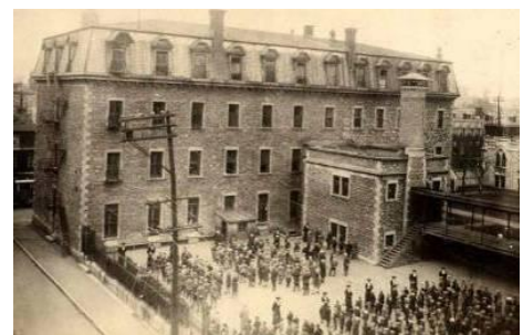
L'école Saint-Pierre, vers 1915.

L'éducation est l'un des aspects incontournables de l'œuvre des Missionnaires Oblats de Marie Immaculée. C'est en septembre 1886, que la nouvelle école Saint-Pierre ouvre ses portes. Le succès est tel que les Oblats entreprennent la construction d'un nouveau bâtiment sur la rue Panet. La fréquentation augmente régulièrement et au début du 20 e siècle, il y a près de 700 élèves inscrits. La brochure L'école Saint-Pierre – 1886-2011 retrace 125 ans d'éducation. Malgré la fermeture de l'école en 1972, l'œuvre éducative des Oblats se poursuit aujourd'hui grâce à la création du Centre St-Pierre, qui a repris le bâtiment de l'école et qui intervient en éducation populaire depuis 1973. La brochure est disponible à l'Écomusée et au Centre St-Pierre.