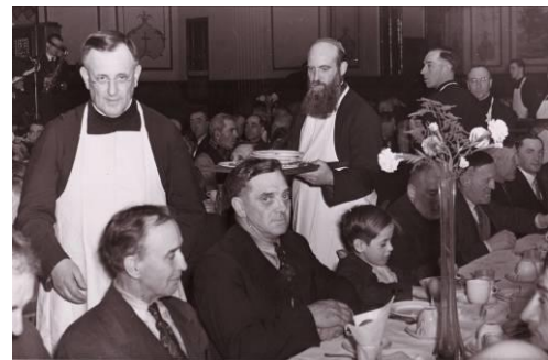
Souper du pauvre dans le sous-sol de l'église Saint-Pierre Apôtre.

À Montréal, c'est dans la paroisse Saint-Pierre Apôtre que nous suivons le parcours des Oblats. Arrivés en 1848, les missionnaires ont érigé une œuvre paroissiale originale auprès d'une population ouvrière défavorisée. Encore aujourd'hui, la communauté chrétienne de Saint-Pierre Apôtre et de Sainte-Brigide se distingue par son ouverture envers les exclus et les personnes gaies. Le Centre St-Pierre porte également l'héritage de cette communauté.