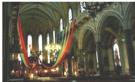
L'église Saint-Pierre Apôtre portant le drapeau de la fierté gaie.

Renseignements : 514 528-8444 | ecomusee.qc.ca