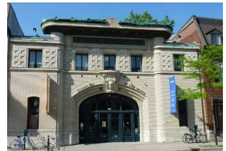
Façade de l'Écomusée du fier monde, 2012.