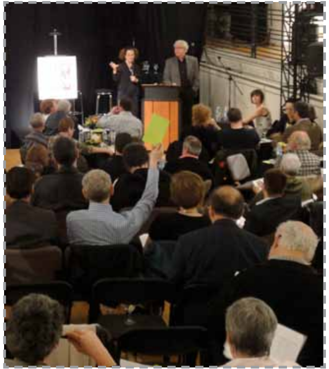
11 e encan annuel

L'Écomusée a réalisé son 11 e encan bénéfice annuel : ce fut le plus grand succès à ce jour en termes de rentabilité. Cette Exposition enchantée est devenue un évènement attendu dans le paysage culturel montréalais et les fonds amassés permettent à l'Écomusée de continuer sa mission. L'évènement peut compter sur l'appui de partenaires importants depuis 10 ans : Encadrex et Robert Alexis traiteur.