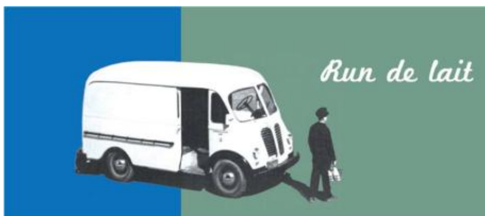
Visuel de l'exposition Run de Lait Graphiste : Diane Urbain

Run de lait est l'aboutissement d'un projet de recherche de plus de 10 ans. Grâce à la collaboration de l'Université du Québec à Montréal (UQAM), qui a nous a donné accès à des ressources permettant une recherche fouillée, l'Écomusée du fier monde a pu explorer l'univers des métiers liés à l'industrie laitière, en particulier celui de laitier. Diverses sources et fonds d'archives ont été mis à contribution, afin de faire avancer les connaissances sur un sujet jusque-là fort peu exploré par les historiens et les musées. En plus des sources historiques classiques, le projet a permis de mettre en branle un chantier en histoire orale auprès des personnes ayant œuvré dans les métiers du lait. Leur contribution par des témoignages, des photos, des documents et des objets est un élément essentiel du projet. Il s'agit d'un important chantier de recherche et de mise en valeur d'un patrimoine immatériel en voie de disparition. L'exposition présentée d'octobre 2010 à mars 2011 était accompagnée d'une publication reprenant les textes et certaines images de l'exposition ainsi que d'un programme d'activités d'animation pour le grand public : conférences, dégustations, visites guidées, rencontres avec des collectionneurs. Elle a profité d'une couverture médiatique importante. Cela a permis de rejoindre un public nombreux et varié, dont une grande proportion ne fréquente que rarement les musées.