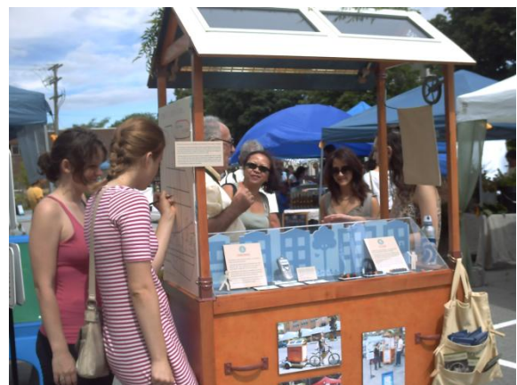
Kiosque au Marché fermier dans Le Plateau Mont-Royal

En parallèle, un kiosque itinérant a permis de nombreuses animations dans le quartier. Le Centre d'écologie urbaine de Montréal était coproducteur de cette exposition, qui réunissait aussi de nombreux partenaires. Excellent exemple