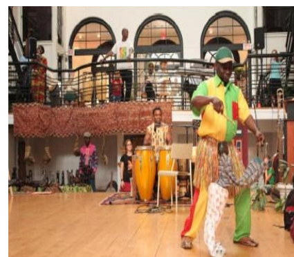
Journées africaines 2010

Animation dans le cadre de l'exposition des adultes de la CSDM Animation dans le cadre de l'exposition La vie exoplanétaire Animation dans le cadre de l'exposition Objets de curiosité Évènements dans le cadre D'Un œil différent Conférences dans le cadre d'Habiter une ville durable Journées africaines Journée des musées Circuits urbains sur les mini-parcs du quartier Week-end du Rassemblement pour l'Art Haïtien Journées de la culture Opération patrimoine architectural de Montréal Midi-vitrine de la Semaine interculturelle à la Polyvalente Pierre-Dupuy Activités de médiation culturelle dans le cadre du projet Ilot Saint-Pierre Programme d'activités dans le cadre de Run de lait Lancement du livre dans le cadre du projet en alphabétisation : La parole est à nous !