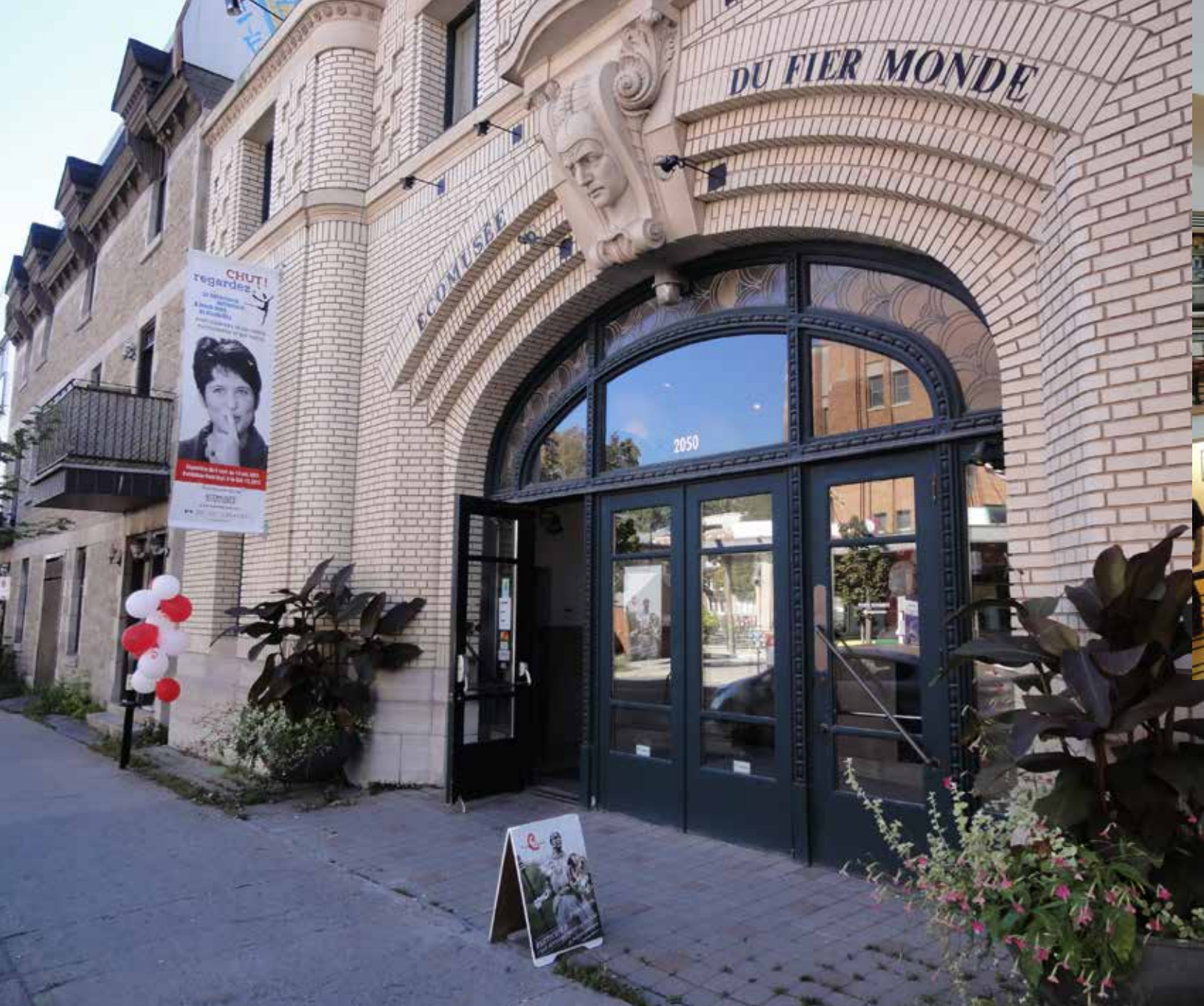
Façade de l'Écomusée du fier monde lors des Journées de la culture