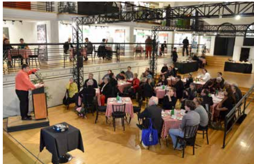
De la taverne... au musée!