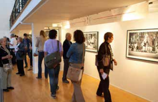
Exposition Chut! Regardez...