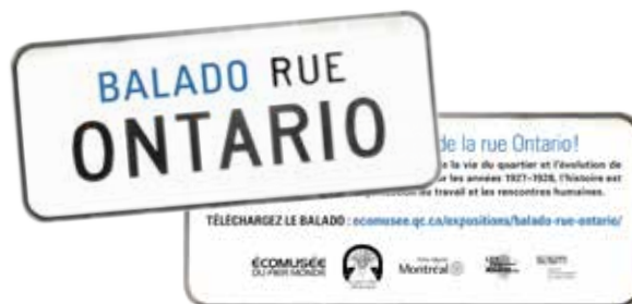
Carton promotionnel du balado Rue Ontario Écomusée du fier monde