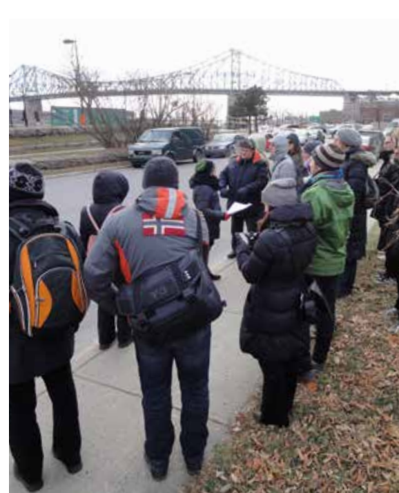
Circuit dans le cadre de l'activité Patrimoine à protéger